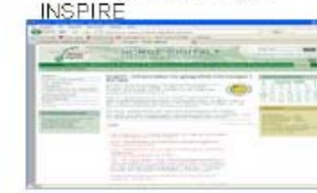
Norway: Norge Digitalt