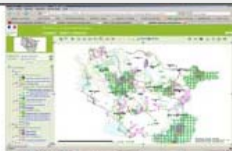
France: CARMEN environmental info system