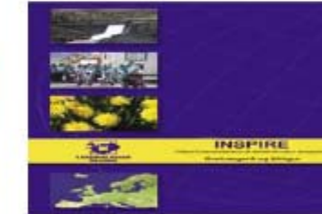
Iceland: getting ready for INSPIRE