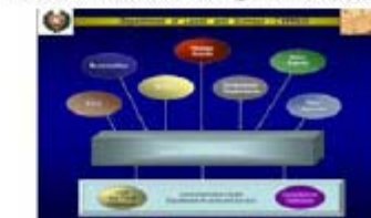
Cyprus: National Land Information Systems