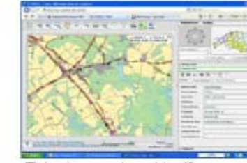
Estonia: road and traffic information systems