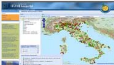
Italy: EIA application integrated in EU-geoportal

INSPIRE: The European Spatial Data Infrastructure 2009 - Max Craglia. INSPIRE Conference 2009 (15 - 19 June 2009, Rotterdam)