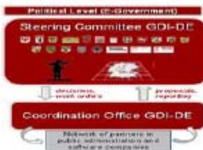
Germany: GDI-DE organisational structure