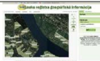
Latvia: IACS-LPIS view services