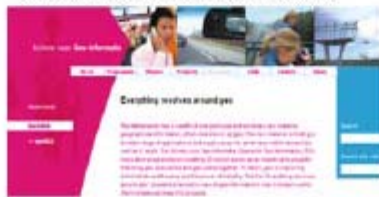
Netherlands: Space for Geoinformation