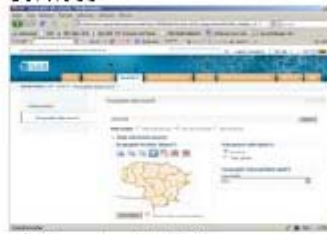
Lithuania: LGII discovery service