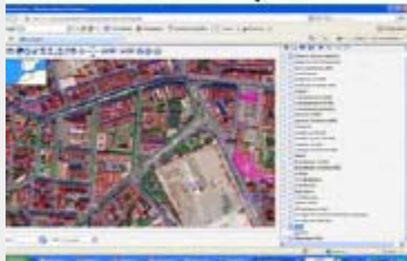
Spain: interoperable Cadastre