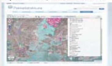
Finland: open source viewer