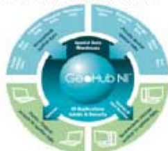
UK: Geohub Northern Ireland