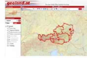
Austria: 9 states, 1 geoservice