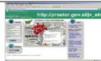
Slovenia: real estate market value register